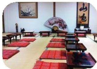
30名様までの収容の宴会場 各種ご宴会・会合にご利用下さい。 幹事さま、ご相談下さい。

〒960-0201 福島県福島市飯坂町字湯沢 21 TEL/FAX 024-542-2702