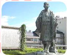
飯坂温泉には松尾芭蕉も立ち寄りました