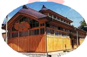
鯖湖湯は日本最古の木造建築共同浴場です