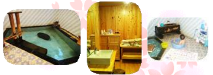
自慢のお風呂は名湯 鯖湖湯と同じ源泉でかけ流し。ご宿泊のお客様はお好きな時間に貸切にてご堪能下さい。