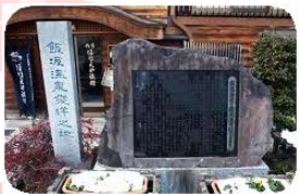
当館の玄関前に飯坂温泉発祥の地の石碑と正岡子規らの句碑があります