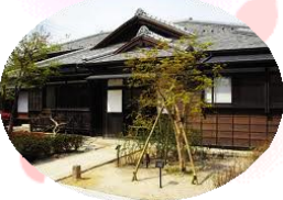
江戸時代から続いていた豪農・豪商の旧家 旧堀切邸 県内最古の土蔵「十間蔵」が現存されています